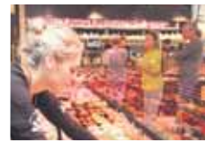
Slagerij Vandecruys volledig vernieuwd