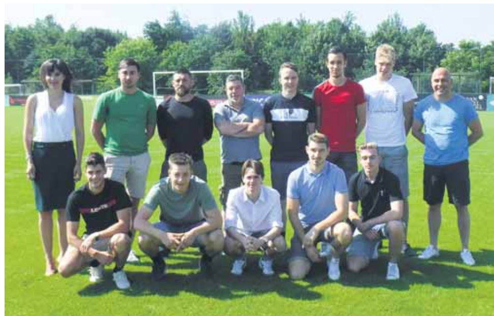
Nieuwkomers en technische staf. - J.T.