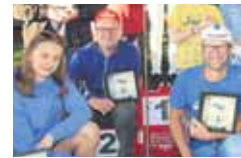
Fotoboek over 'Ronde van Rielen'