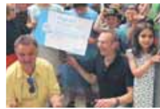
Leerlingen beloofd voor 'propere acties'

Tel. 014 55 55 55 info@drukkerijbaudoin.be www.drukkerijbaudoin.be